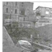
8 a, b