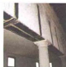
7 a, b, c, d